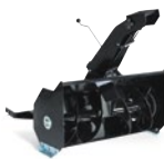
Sněhová fréza se záběrem 90 cm, existuje i dvoustupňová varianta