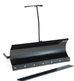
Sněhová radlice se záběrem 120 cm